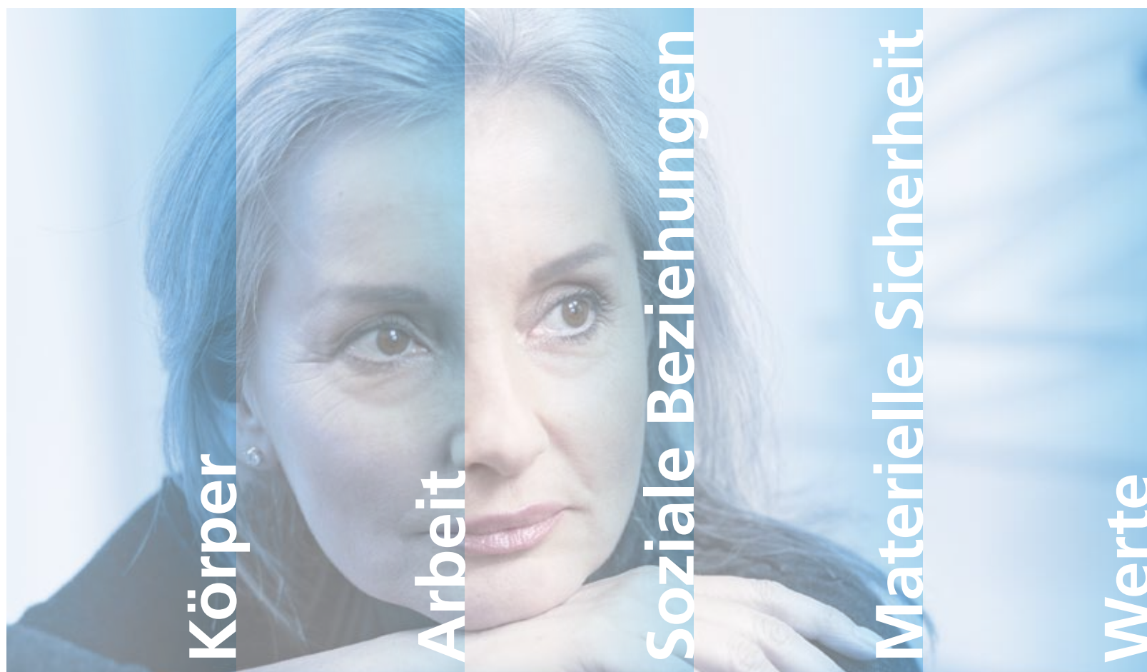
Die 5 Säulen der menschlichen Identität erfahren bei an Krebs Erkrankten gravierende Risse (nach Petzold)